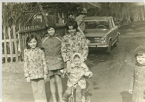
«Пушкинские» дети 70-е годы.