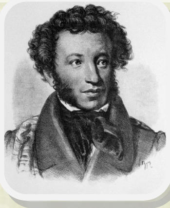
Александр Сергеевич Пушкин (1799-1837 г.г.)

...В центре города, скрытая от посторонних глаз домами-великанами, тихо доживает свой век улица. Без людского пригляду она безропотно тает в каменных джунглях мегаполиса. Единственные свидетели ее гибели — четыре деревянных дома, на древесных боках которых нацарапано: «улица Пушкина» — так пока зовут эту улицу. Она родилась в начале 1900-ых . Начинаясь от Кабинетской и тянулась до Нового кладбища, вдоль ипподрома. В 1920-е на ней живут модные портные (дом №62), работает карамельно-кондитерское производство ( дом №53).