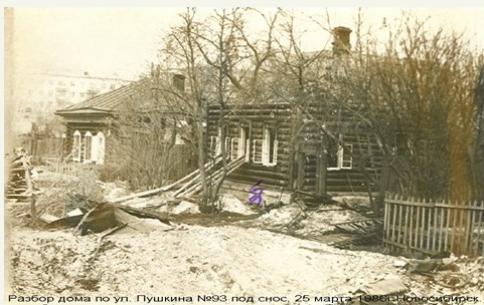
Разбор дома по ул. Пушкина №93 под снос, 25 марта, 1996 г. Новосибирск.