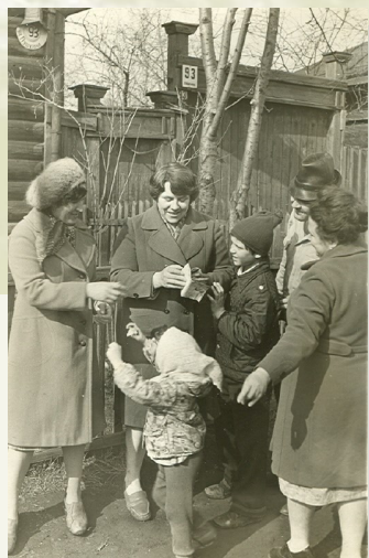
Жители улицы Пушкина 1970-е годы.

Пушкинский сад, так ласково называли это местечко местные жители, цвел полвека. Затем дома стали поджиматься новостройками, их сносили, давая взамен жилье «со всеми удобствами».